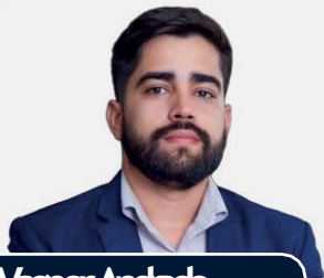
Vagner Andade Engenharia Civil

Mais de 10 anos de atuação no setor de construção civil. Atuação como engenheiro de custos e orçamentos, com forte conhecimento na elaboração de registros. Pós-graduação em Engenharia de Custos e Orçamentos pelo Instituto de Educação Tecnológica (IETEC).