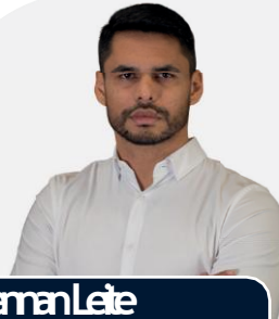
Reman Leite Engenharia Civil

Engenheiro Civil pela UFRN, especialista em Infraestrutura de Transportes pelo INBEC, MBA em Gestão de Projetos pela USP. Especialista na realização de perícias e auditorias em contratos de obras de infraestrutura, administração contratual e na preparação e defesa de pleitos de reequilíbrio econômico-financeiro.